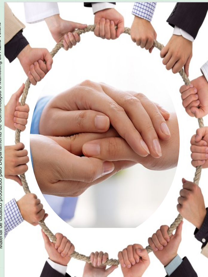
Material de didático produzido pelo Departamento de Comunicação e Marketing do Alzira Velano

VOCÊ É IMPORTANTE PARA A SEGURANÇA DO PACIENTE!